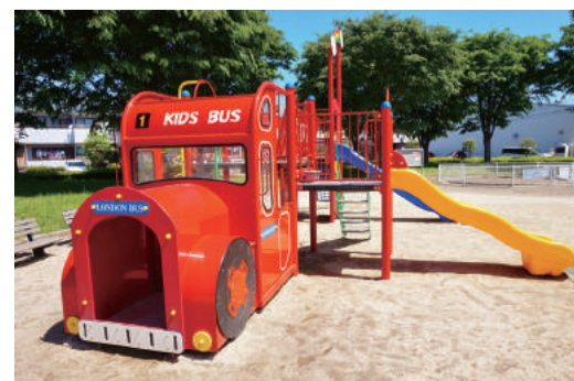
戸塚はさみ第二公園