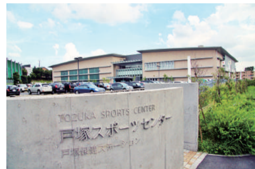
戸塚スポーツセンター