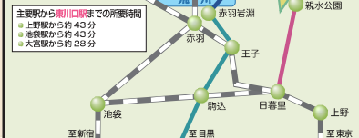
川口市経済部産業振興課

〒332-8601 川口市青木2-1-1 電話:048(259)9018 FAX:048(259)2622