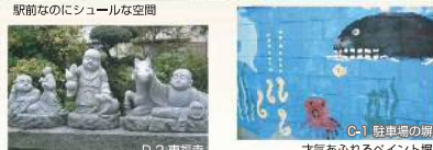
B-1 東川口駅南口 駅前なのにシュールな空間 C-1 駐車場の塀 才気あふれるペイント塀