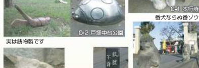
C-2 戸塚中台公園 チリモノに一年中 C-2 戸塚中台公園 番犬ならぬ番ソウ